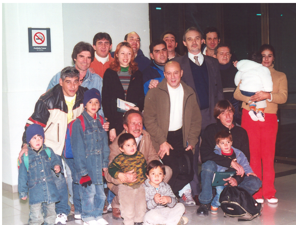
Un gruppo di lavoratori italo argentini di rientro selezionati per il Gruppo Maltauro (Aeroporto di Cordoba, 8 giugno 2004)

Provincia di Padova Settore Lavoro - Formazione